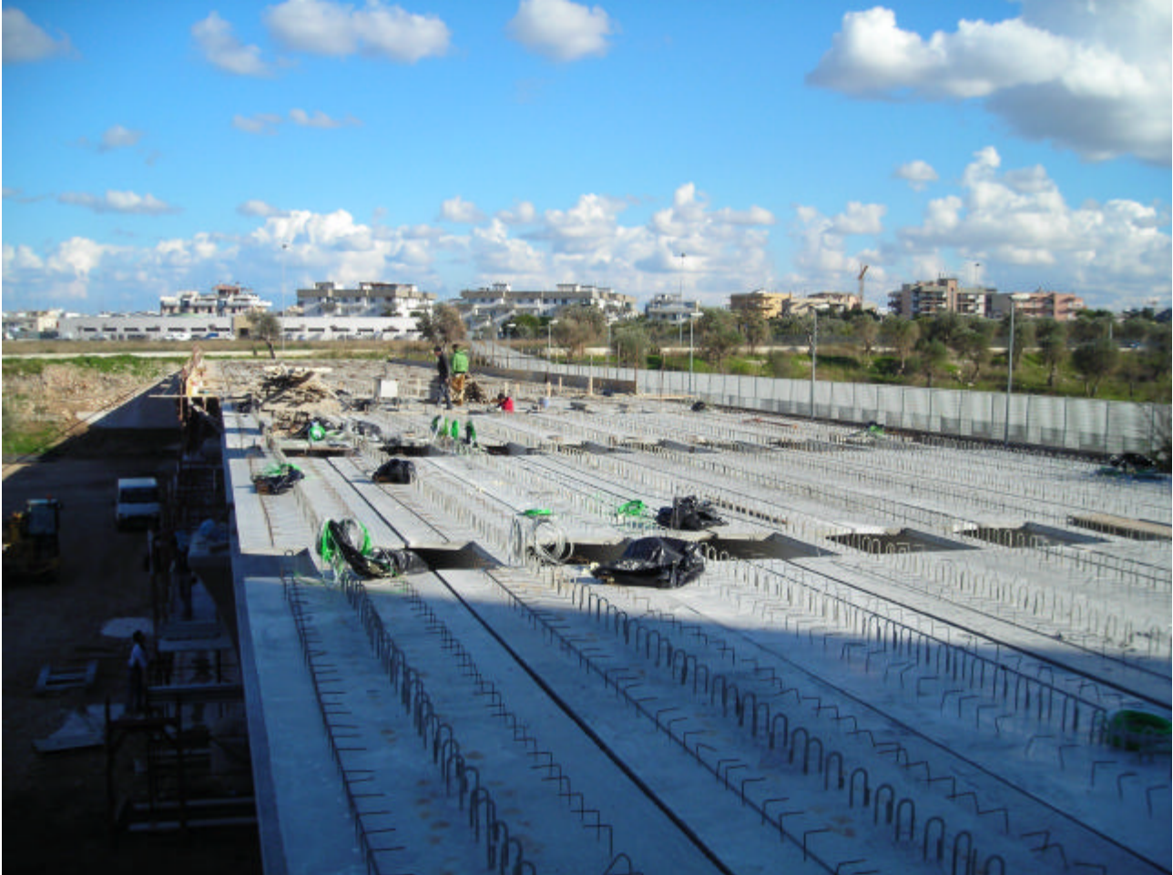
POSA IN OPERA DELLE TRAVI

SISMLAB s.r.l. Spin-Off Università della Calabria Via Pietro Bucci - 87036 Rende (CS) – ITALY Tel. : 0984 – 447093 --- Fax: 0984 – 447093 E-mail: info@sismlab.it ---Internet: www.sismlab.it