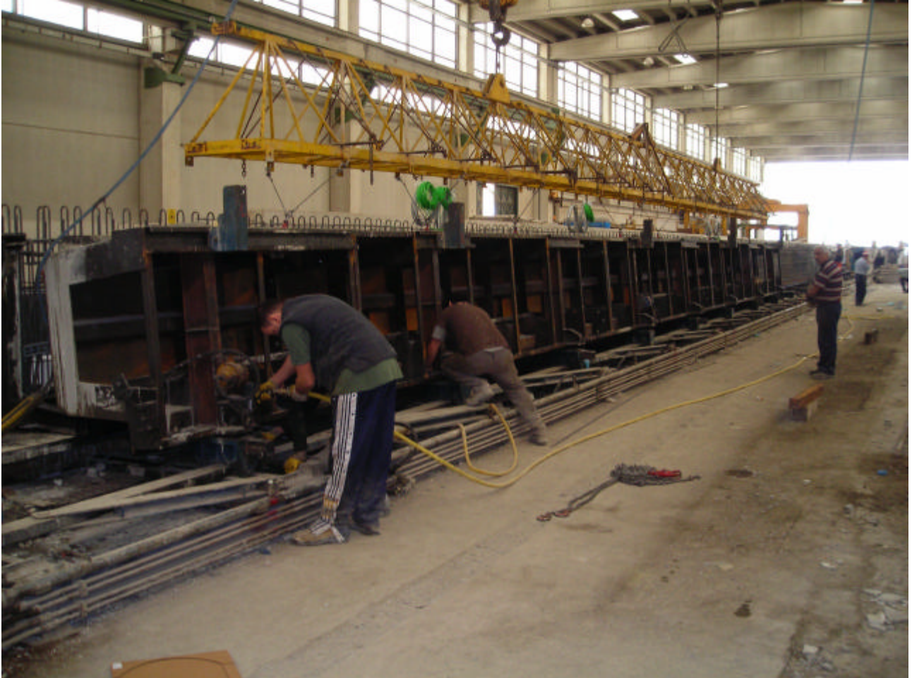
POSA DEL CASSERO

SISMLAB s.r.l. Spin-Off Università della Calabria Via Pietro Bucci - 87036 Rende (CS) – ITALY Tel. : 0984 – 447093 --- Fax: 0984 – 447093 E-mail: info@sismlab.it ---Internet: www.sismlab.it