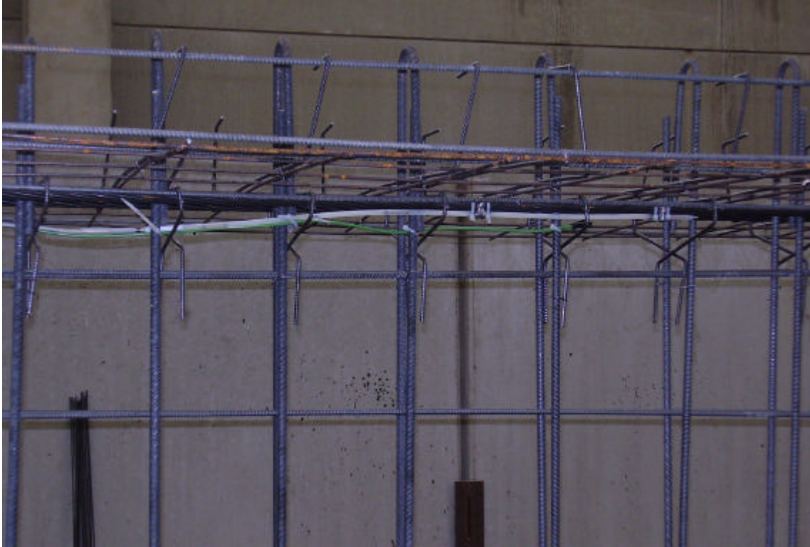
INSTALLAZIONE DEI SENSORI E DELLE TERMOCOPPIE

SISMLAB s.r.l. Spin-Off Università della Calabria Via Pietro Bucci - 87036 Rende (CS) – ITALY Tel. : 0984 – 447093 --- Fax: 0984 – 447093 E-mail: info@sismlab.it ---Internet: www.sismlab.it