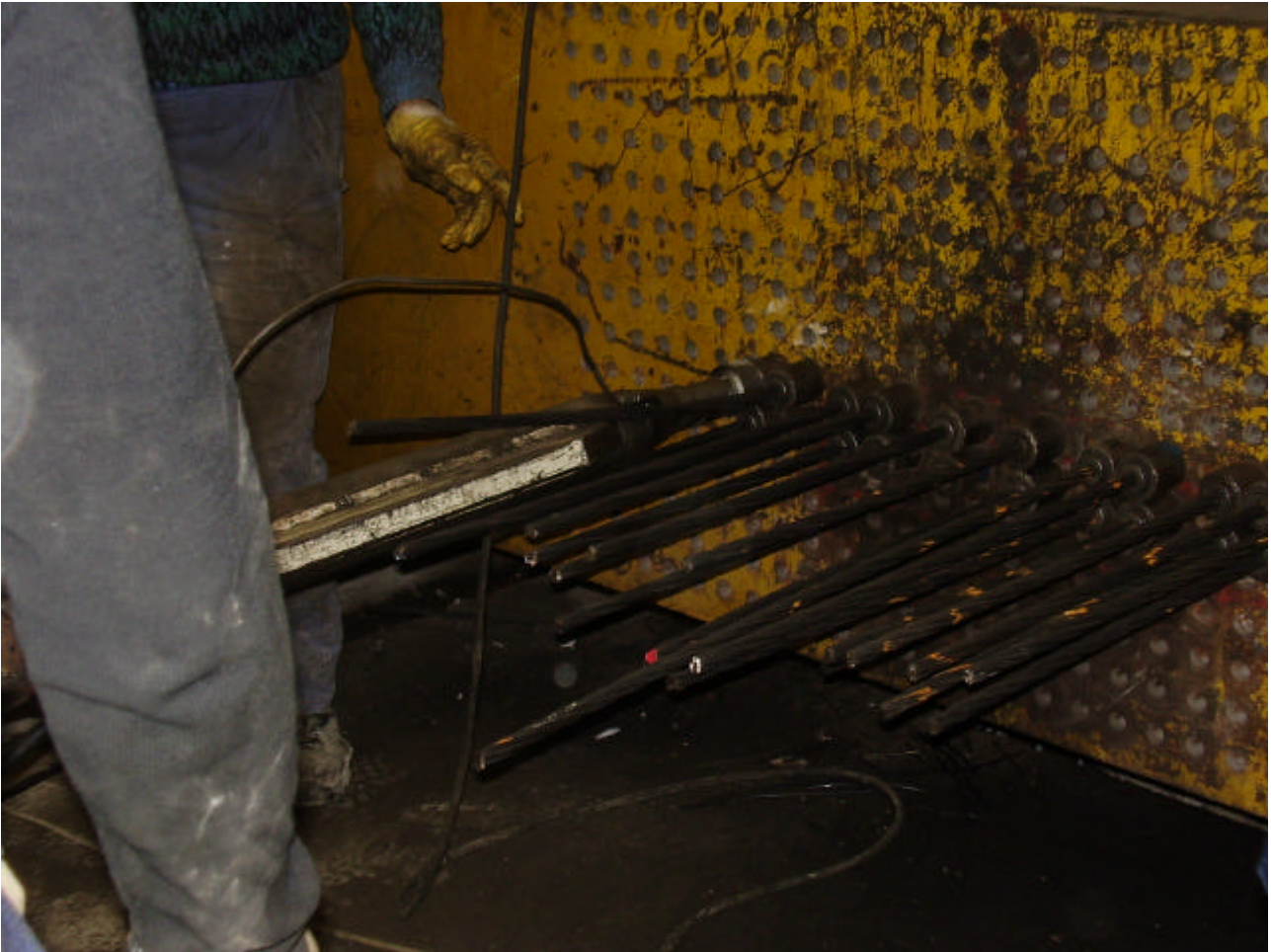
FASE DI TIRO

SISMLAB s.r.l. Spin-Off Università della Calabria Via Pietro Bucci - 87036 Rende (CS) – ITALY Tel. : 0984 – 447093 --- Fax: 0984 – 447093 E-mail: info@sismlab.it ---Internet: www.sismlab.it