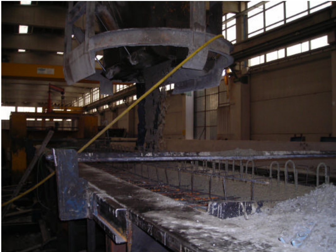
FASE DI GETTO

SISMLAB s.r.l. Spin-Off Università della Calabria Via Pietro Bucci - 87036 Rende (CS) – ITALY Tel. : 0984 – 447093 --- Fax: 0984 – 447093 E-mail: info@sismmlab.it ---Internet: www.sismmlab.it