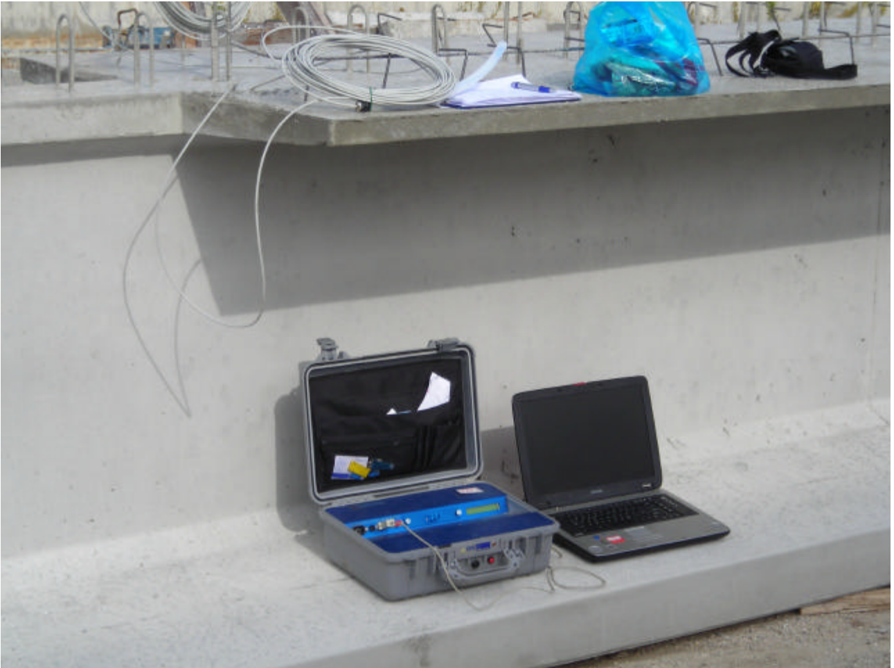
FASE DI MISURA

SISMLAB s.r.l. Spin-Off Università della Calabria Via Pietro Bucci - 87036 Rende (CS) – ITALY Tel. : 0984 – 447093 --- Fax: 0984 – 447093 E-mail: info@sismlab.it ---Internet: www.sismlab.it