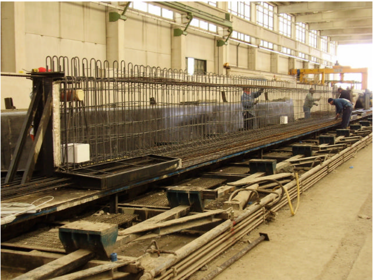
PISTA DI TIRO TRAVE IN C.A.P.