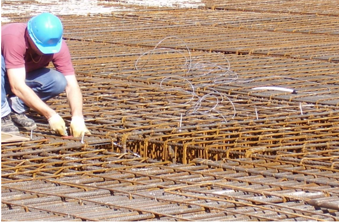
INSTALLAZIONE DEL SENSORE SU UNA TRAVE DI FONDAZIONE

E-mail: info@sismmlab.it ---Internet: www.sismmlab.it