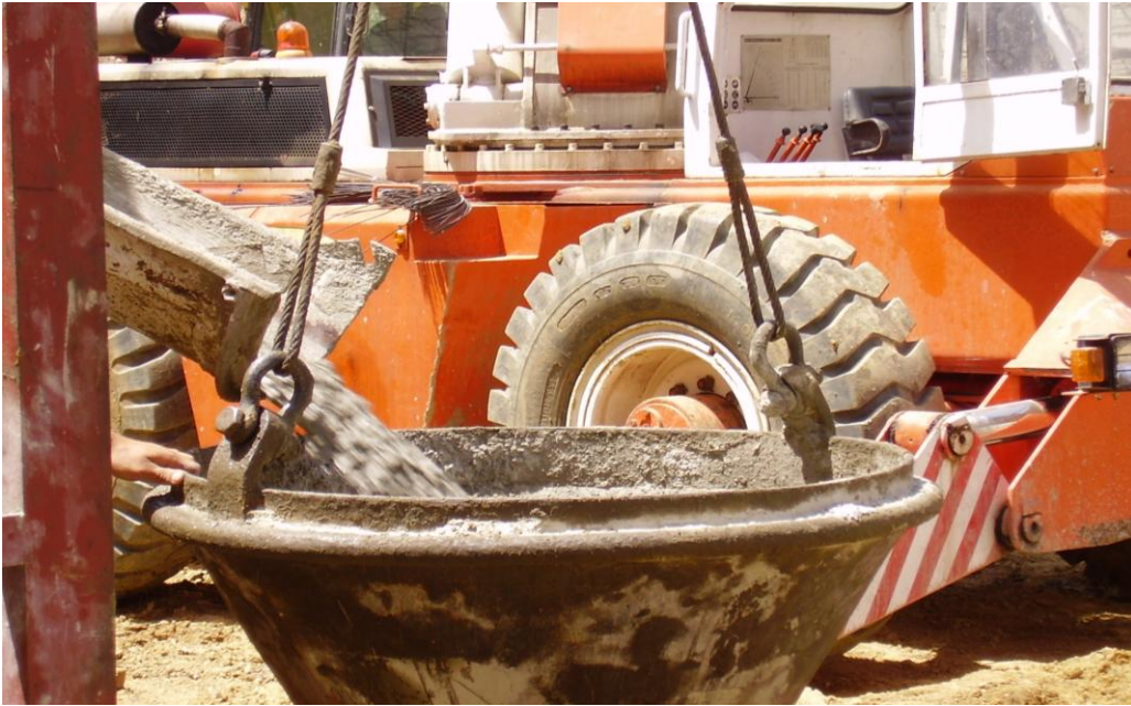
FASE DI GETTO

E-mail: info@sismilab.it ---Internet: www.sismilab.it