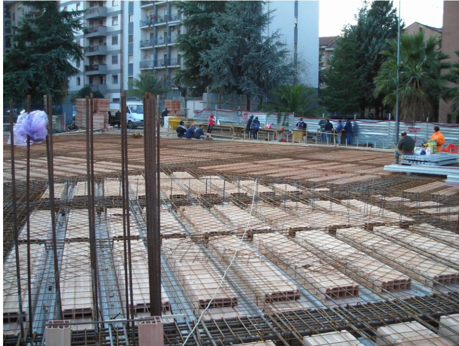
TRAVE STRUMENTATA (1 LIVELLO)