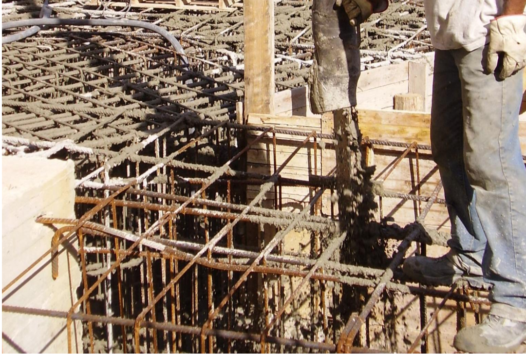
FASE DI GETTO

SISMLAB s.r.l. Spin-Off Università della Calabria Via Pietro Bucci - 87036 Rende (CS) – ITALY Tel. : 0984 – 447093 --- Fax: 0984 – 447093 E-mail: info@sismmlab.it ---Internet: www.sismmlab.it