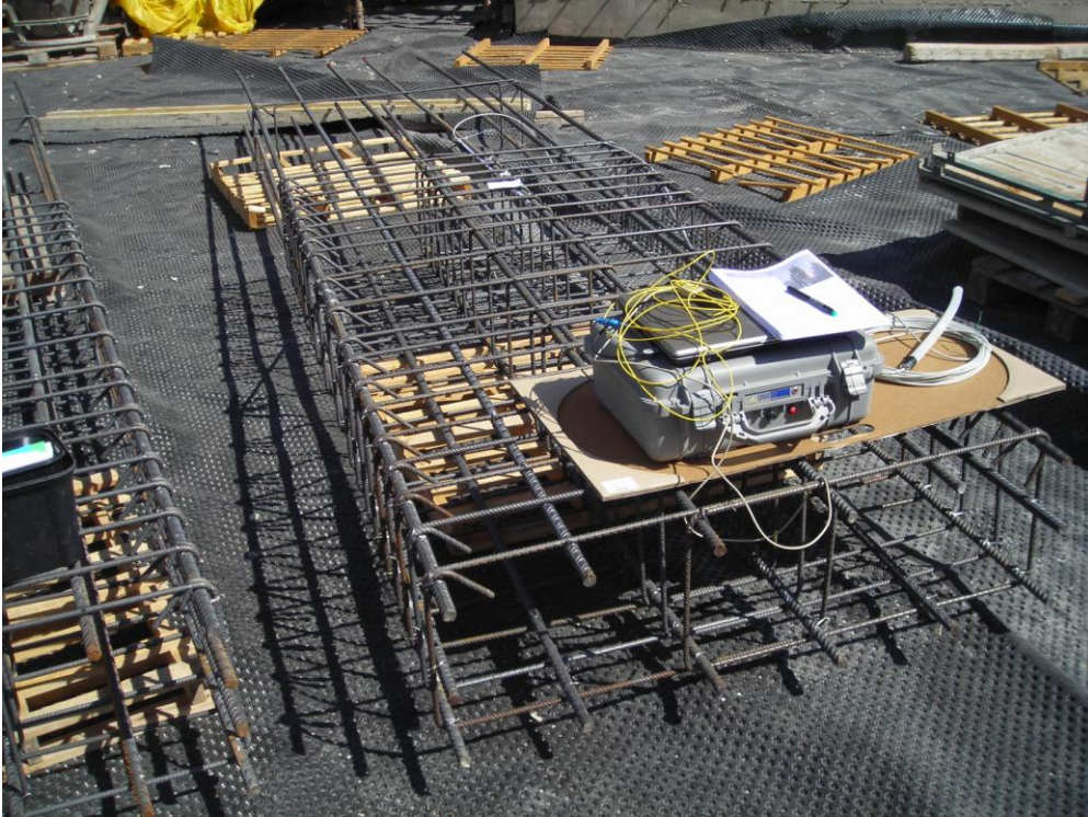
PILASTRO STRUMENTATO (XVIII ORDINE)

SISMLAB s.r.l. Spin-Off Università della Calabria Via Pietro Bucci - 87036 Rende (CS) – ITALY Tel. : 0984 – 447093 --- Fax: 0984 – 447093 E-mail: info@sismmlab.it ---Internet: www.sismmlab.it