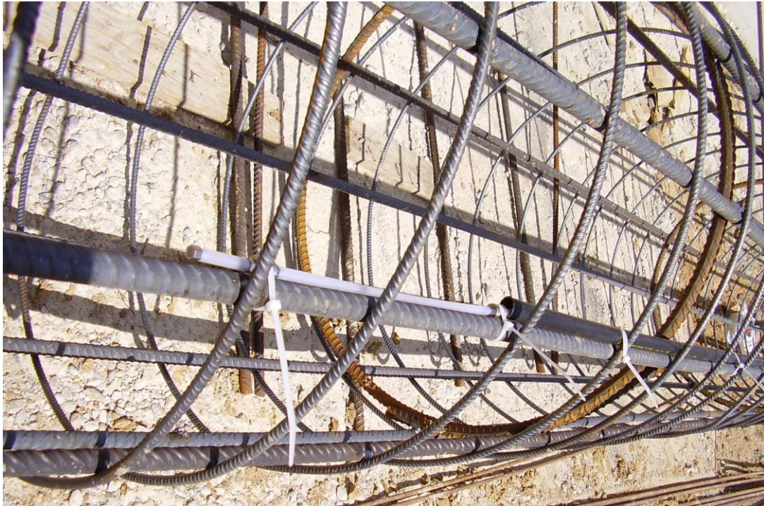
POSA IN OPERA DELLE ARMATURE MONITORATE

SISMLAB s.r.l. Spin-Off Università della Calabria Via Pietro Bucci - 87036 Rende (CS) – ITALY Tel. : 0984 – 447093 --- Fax: 0984 – 447093 E-mail: info@sismmlab.it ---Internet: www.sismmlab.it