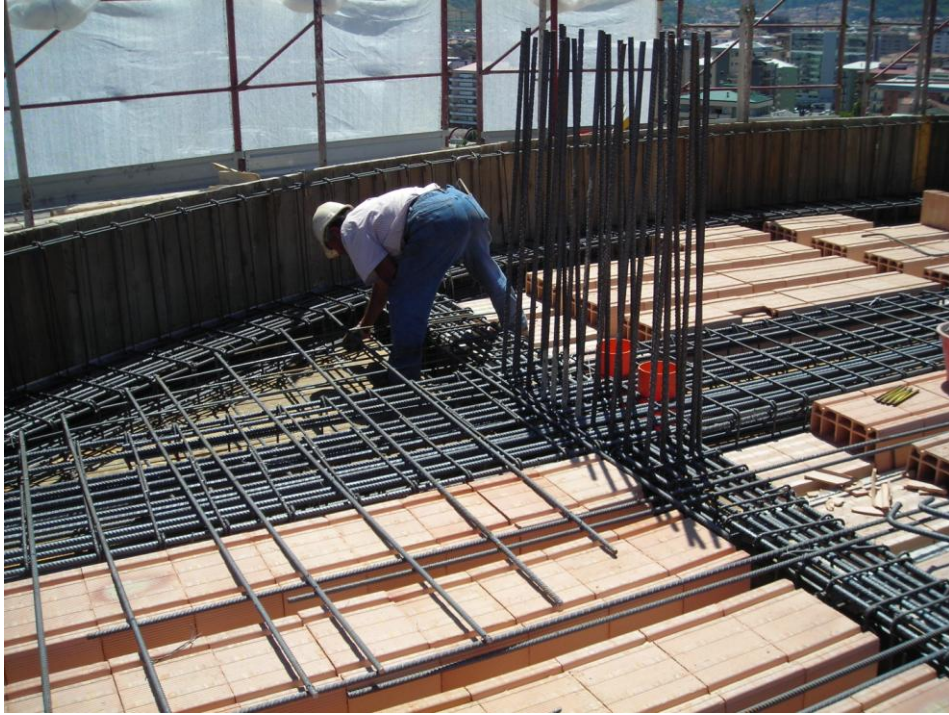
TRAVE STRUMENTATA (XVI LIVELLO)

SISMLAB s.r.l. Spin-Off Università della Calabria Via Pietro Bucci - 87036 Rende (CS) – ITALY Tel. : 0984 – 447093 --- Fax: 0984 – 447093 E-mail: info@sismilab.it ---Internet: www.sismilab.it