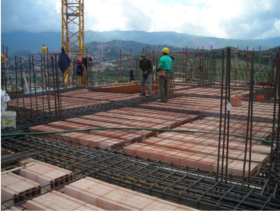
TRAVE STRUMENTATA (XX LIVELLO)

SISMLAB s.r.l. Spin-Off Università della Calabria Via Pietro Bucci - 87036 Rende (CS) – ITALY Tel. : 0984 – 447093 --- Fax: 0984 – 447093 E-mail: info@sismilab.it ---Internet: www.sismilab.it