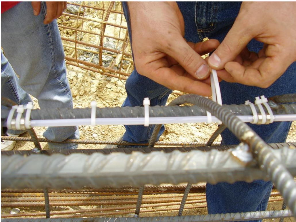
FISSAGGIO DEI SENSORI ALLE ARMATURE