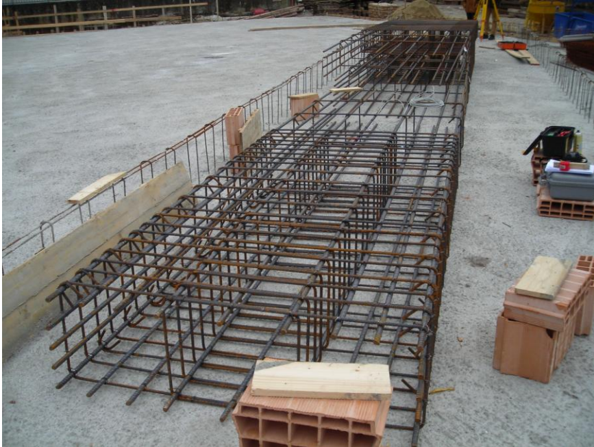
PILASTRO STRUMENTATO (II ORDINE)

SISMLAB s.r.l. Spin-Off Università della Calabria Via Pietro Bucci - 87036 Rende (CS) – ITALY Tel. : 0984 – 447093 --- Fax: 0984 – 447093 E-mail: info@sismmlab.it ---Internet: www.sismmlab.it